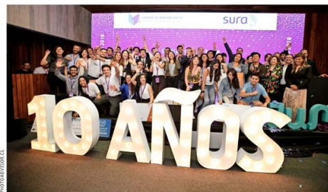
La semifinal congregó a 30 proyectos, donde solo 12 pasaron a la final, de los cuales siete son chilenos. Además fueron distinguidos proyectos dirigidos al adulto mayor y la sostenibilidad.