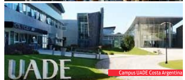
Campus UADE Costa Argentina