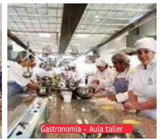
Gastronomía - Aula taller