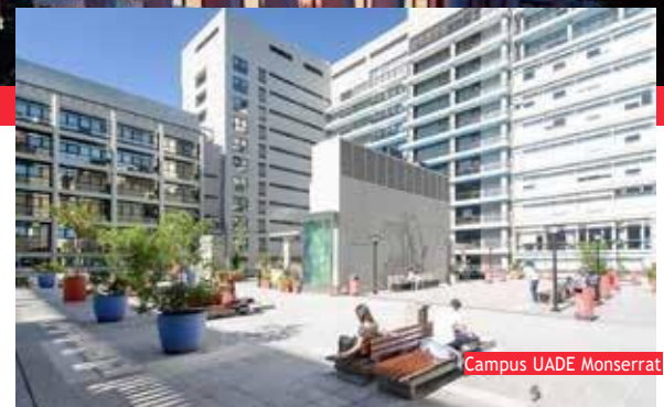
Campus UADE Monserrat